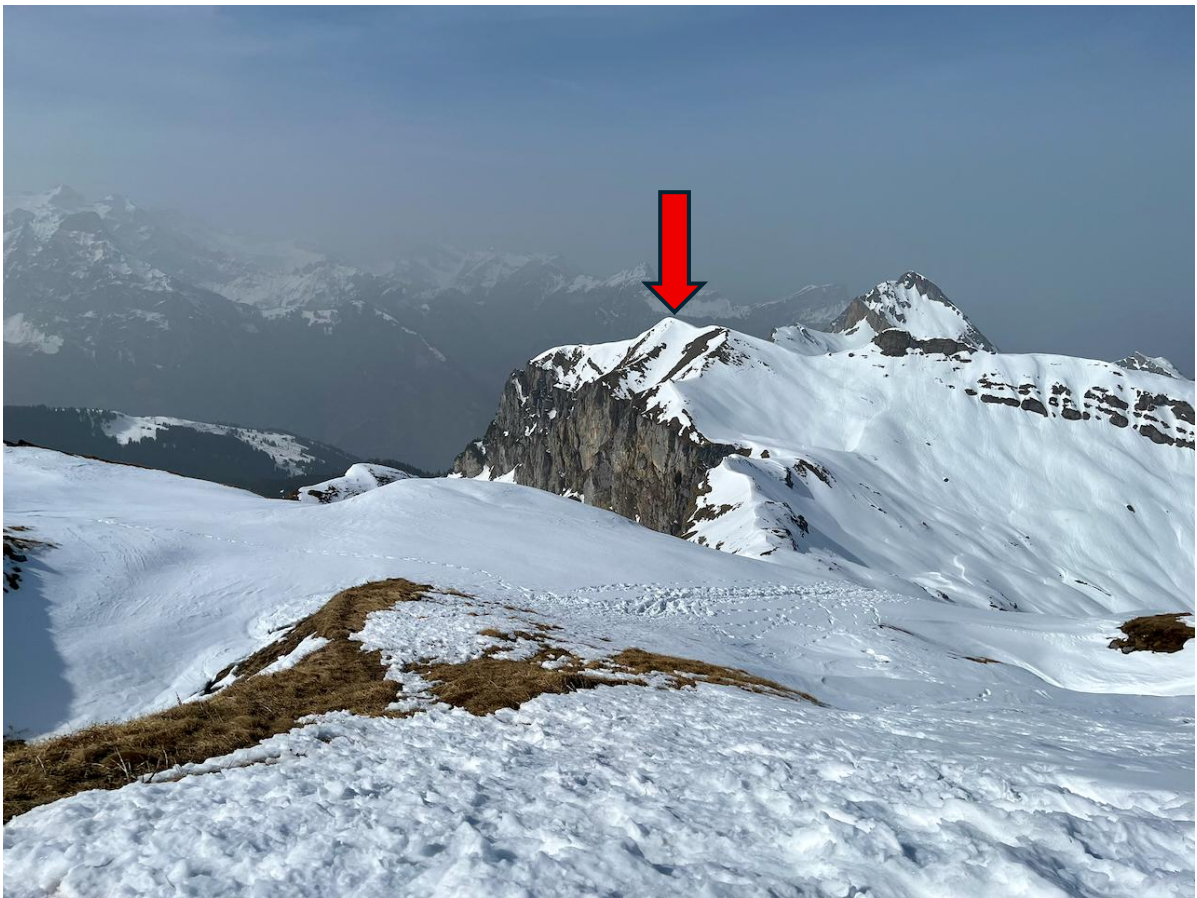
Pfeil: Hagelstock vom Spilauerstock