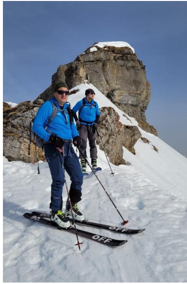
Kurz vor dem Hagelstock