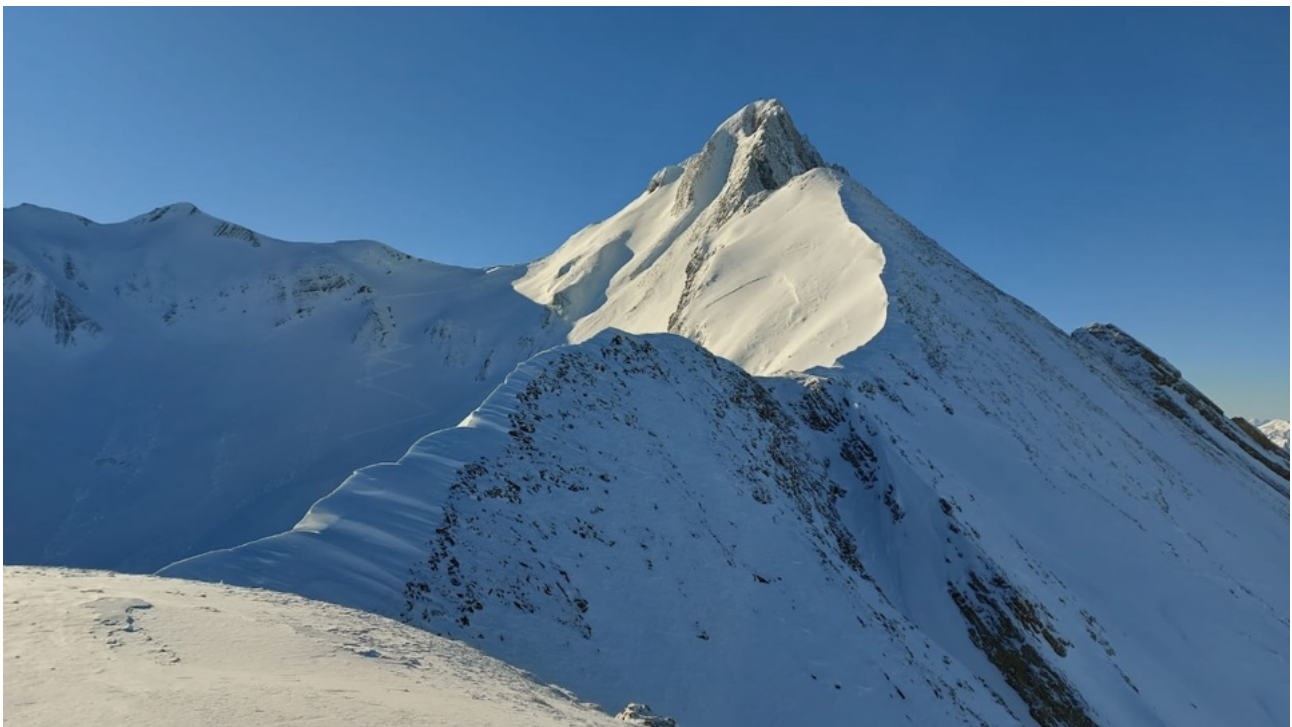
Brisen, 2404m. Auf dem Sattel links vom Gipfel werden die Skier deponiert. Der Aufstieg zum Gipfel erfolgt zu Fuss.

Zügig ging es von der Bergstation der Luftseilbahn Gitschenen (1538 m) Richtung Westen durch die wenig steile Talmulde, allmählich steiler und enger weiter taleinwärts. Bis zum Pièce de Résistance - dem steilen Nordosthang (39° Neigung auf 60 Hm) zum Sattel (2330 m) zwischen Brisen und Hoh Brisen. Wegen des frisch gefallenen Schnees, der auf einer gefrorenen Schnee-/Eisdecke zu liegen kam, verzichteten wir aus Sicherheitsgründen darauf und erklommen einen namenlosen Nebengupf (2250 m) mit schöner Aussicht auf Brisen, Vierwaldstättersee, Pilatus und die umliegende Bergwelt.