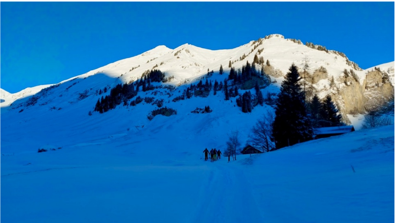
Start im Schatten bei zweistelligen Minustemperaturen.