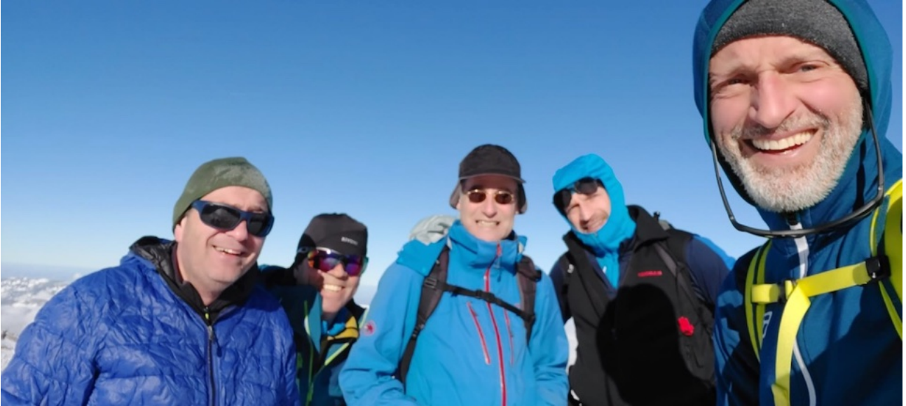
Gipelfoti mit allen Teilnehmenden der Januar-Monatsskitour

Die Abfahrt überraschte uns alle positiv. Wir genossen jeden Schwung im Pulverschnee bis zum flachen Schlussteil, auf welchem einige sanft daran erinnert wurden, die Skier wieder mal neu zu wachsen.