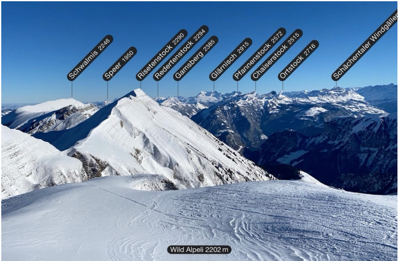
Blick Richtung Osten auf die Zentralschweizer Alpen