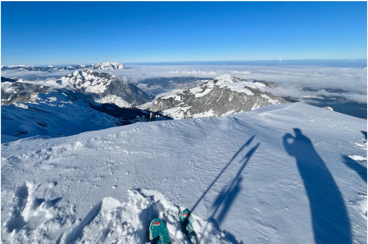
Ausblick vom Ziel auf Buochserhorn, Stanserhorn, Pilatus und die 80 km entfernte Dampffahne vom KKW Leibstadt.