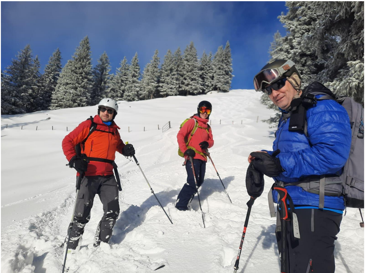
Abfahrt bei Sonnenschein und herrlichem Powder