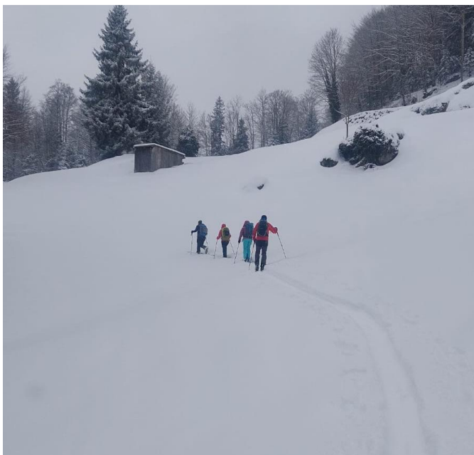
Kurz nach dem Start noch viele Wolken