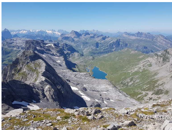
Der Glattalpsee vom Gipfel her gesehen