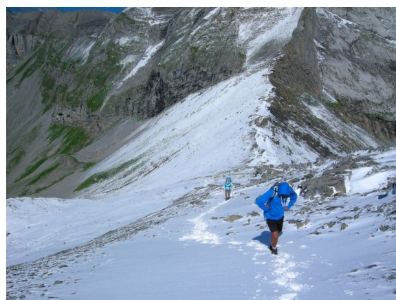
Unser Endaufstieg zum Gipfel im Frühjahr 2014